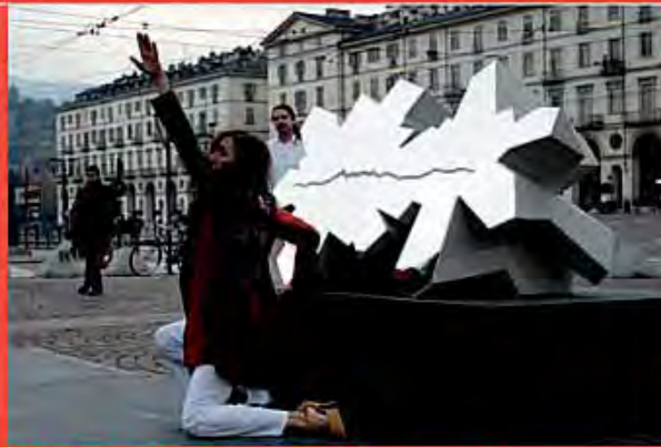
Geode “Universo Dentro”, in occasione di una esposizione, a Torino, in Piazza Vittorio. The Inner Universe geode exhibited in Piazza Vittorio, Turin.

BOX 3 – LA SCULTURA “UNIVERSO DENTRO” DI DANIELE BASSO: VIRTUOSISMO TECNOLOGICO RICCO DI SIGNIFICATI [THE INNER UNIVERSE SCULPTURE BY DANIELE BASSO: TECHNOLOGICAL VIRTUOSITY FULL OF MEANINGS]