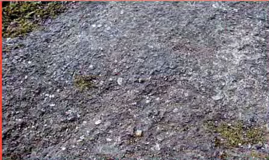
Mica muscovite nel filone Luz de Compostella™ / Muscovite mica in the Luz de Compostella™ seam.

La muscovite è un silicato appartenente al gruppo delle miche. Le lamine di questo materiale posseggono una lucentezza vitrea perlacea, interessante per la sfumatura talora argentata. Il termine "mica" si ritiene che derivi dal latino "micare" ossia "brillare". Il termine "muscovite" invece è da ricondurre alla città di Mosca, dove questo materiale veniva usato al posto del vetro in gran quantità: alcune abitazioni russe avevano finestre in muscovite. La mica muscovite si trova per lo più in rocce magmatiche intrusive in silice (graniti, sieniti, ecc.) e in rocce metamorfiche.