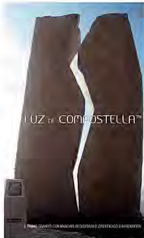
Immagine suggestiva dei blocchi di granito Luz de Compostella™ / A lovely photo of blocks of Luz de Compostella™ granite.

Thus the two registered trademarks that protect "identity" and "spiritual value" appear to trace a new way of gaining renown for the authentic stone product, distancing it from the counterfeit and from the lower cost of other, "not well identified" materials. Other steps are also going in this direction (for example towards protecting prestigious "Carrara marble"). And this granite of historical European tradition is trying to strengthen the concept of protecting raw material in the stone sector, telling us more about it. On the one hand, the glitter of the muscovite mica it contains seems to be a metaphorical reference to a higher value, the spiritual, even harder to "monetize". On the other, the design exploration done with this material delineates a new challenge aimed at the rebirth of a "stone culture" and of design culture, with direct citation of ancestral values intimately tying humankind to its origins, to matter, to "looking inward" with an "ethical-philosophical" meaning.