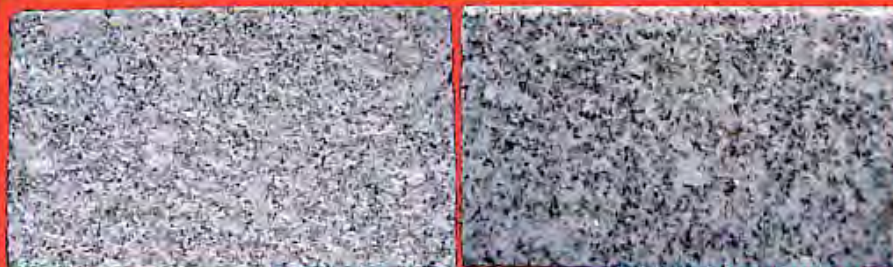
Campione di granito Luz de Compostella™, fiammato (a sinistra) e lucido (a destra). Samples of Luz de Compostella™ granite, flamed (left) and polished (right).