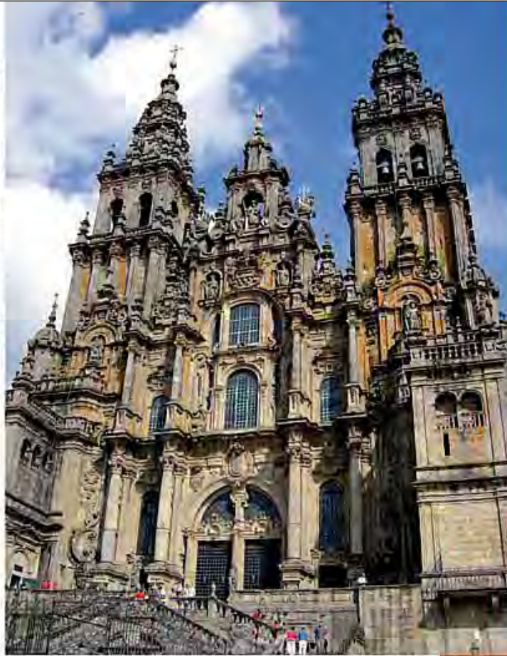
La Basilica di Santiago di Compostela (XI-XIII sec.) in Spagna. The Santiago de Compostela Cathedral (XI-XIII centuries) in Spain.

percorso lungo circa 800 Km. In tutta Europa antiche e storiche strade si congiungono al Cammino di Santiago: esse costituivano nel Medioevo un'importante rete di viabilità, che ha contribuito a creare l'Europa, unendo le genti e scambiando culture. Il Cammino di Santiago è stato dichiarato dall'UNESCO Patrimonio dell'Umanità. Anche il Consiglio d'Europa, nel 1987, ne ha riconosciuto il valore culturale: ha dichiarato la "via di Santiago" quale "itinerario culturale europeo", richiamando l'importanza di questo, come di altri cammini religiosi, dal punto di vista storico-culturale. Il Cammino di Santiago è stato altresì identificato con un logo, in cui una "conchiglia", simbolo dei pellegrini, appare stilizzata nelle pietre miliari poste lungo il percorso.