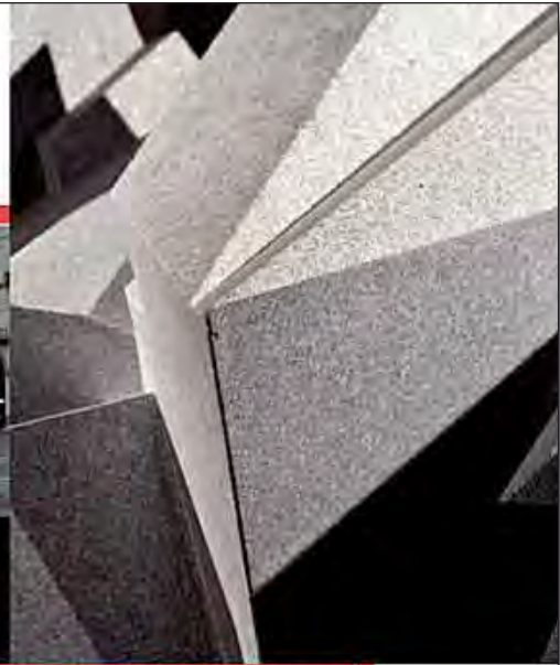
Virtuosismi tecnologici (la scultura, fruita da un’altra angolatura). Technological virtuosity (the sculpture, seen from a different angle).

“ Universo Dentro ”. Proposta alle recenti manifestazioni fieristiche di Verona, “Universo Dentro” è firmata da Daniele Basso (dello studio Glocal Design di Biella, Torino), intesa come opera “che arreda i luoghi non-luoghi”. Un enorme geode in granito Luz de Compostella™: una scultura del peso di due tonnellate e mezzo, dalle notevoli dimensioni (1800 mm x 900 mm, prof. 700 mm), realizzata con un grande impegno tecnologico, sfruttando alle massime potenzialità frese, taglio ad acqua ad elevata pressione e filo diamantato. Il retro è stato lavorato tutto con spigoli vivi, ai limiti della possibilità della macchina. Il geode è “sfondato” dallo specchio “Dreamscape”.