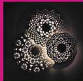
Exhibit of the artist Daniele Basso in cooperation with GlocalDesign and ITALAMP. Thought and emotions become lights, colors and sculptures in steel and mirror, to reflect upon the future of our society and of all of us.

c/o Nhow Hotel - Terzo piano via Tortona, 35