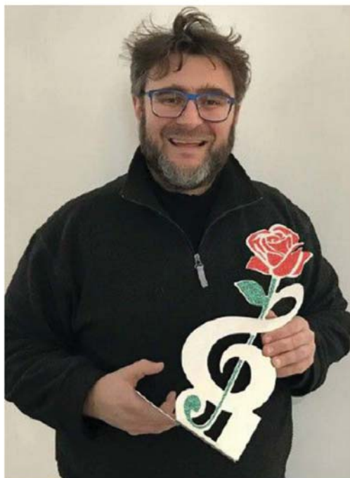
L'ARTISTA BIELLESE con uno dei "pezzi"

Dieci come gli anni dall'inizio dell'avventura di Casa Sanremo. Dieci come dieci protagonisti italiani, fuori dal settore musicale,