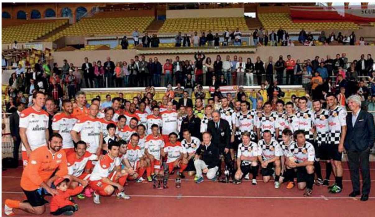
Monaco, la Nazionale Piloti alla 25 a World Stars Football Match

MONACO. 24 MAG. Allo Stadio Louis II di Monaco, la Nazionale Piloti ha aperto la 36ma stagione di attività con la 25ma edizione del World Stars Football Match.