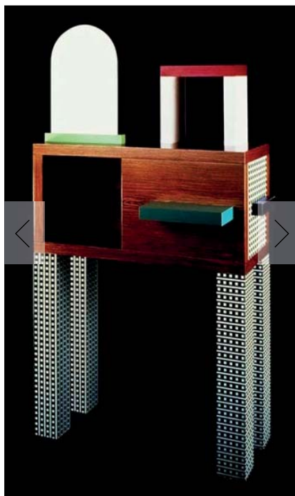
1 - 3 MEMPHIS DESIGN, NATHALIE DU PASQUIER, EMERALD.

La mostra di quest'anno rende omaggio all'imprenditore Giovanni Agnelli, detto Gianni Agnelli, patron della Fiat, da sempre legato alla località turistica toscana.