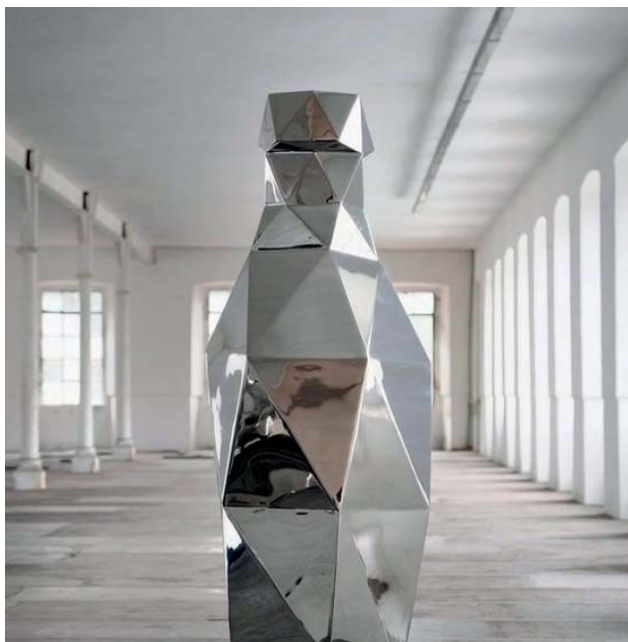
FORTE DEI MARMÌ