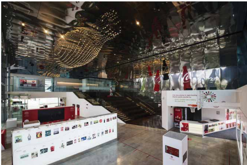
Il Padiglione Coca-Cola a Expo 2015 progettato dall'architetto Giampiero Peia (Peia Associati) insieme all'agenzia di brand experience psLIVE.

Fino al 18 maggio, una mostra dal titolo L'arte in bottiglia: i primi 100 anni della iconica bottiglia Coca Cola festeggia il 100esimo anniversario di un simbolo del design mondiale, la bottiglietta 'Contour'. L'esposizione racconta un rapporto antico tra una bottiglietta e l'arte. Tra le altre, presenti opere di Andy Warhol, Todd Ford, Luigi Bona e dell'artista italiano Daniele Basso dal titolo Coke it's me.