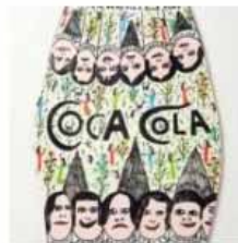
Opera di Howard Finster