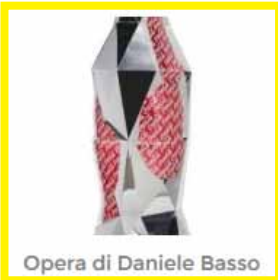
Opera di Daniele Basso