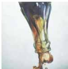
Opera di Todd Ford