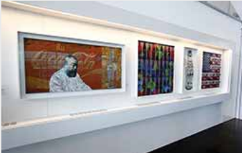
Art in a bottle at the Coca-Cola Pavillon