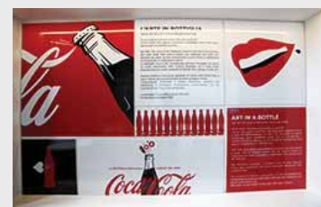
Art in a Bottle