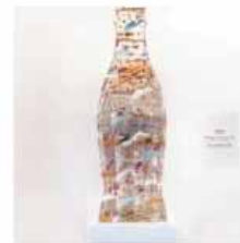
Opera di Howard Finster