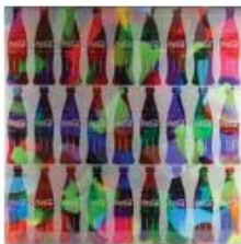
Opera di Alberto Murillo

Una curiosità: in un angolo del padiglione potrete degustare anche tutte le varianti della classica Coca-Cola, da quella alla ciliegia fino a quella aromatizzata alla vaniglia.