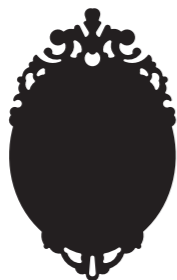
ECCENTRICO 33 x 55 cm - 0,53 kg 55 x 90 cm - 1,35 Kg 73 x 120 cm - 1,95 Kg