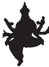
RUMOUR 53,5 x 71 cm - 1,6 kg

L'iper-comunicazione prende vita... Nell'era della comunicazione ferisce più la lingua della spada. Spettacularizzazione della vita personale, violazione della privacy ed intercettazioni morbose riempiono giornali e televisione. Senza rendercene conto siamo in catene come non mai nella storia dell'uomo! La "Dea delle Comunicazioni" ci tiene in pugno.