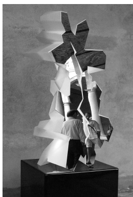
Kryste_dBasso - 54BiennaleVE (1).jpg