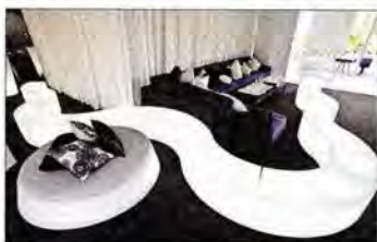
Il progetto Slide art-Sign Off Design, nelle foto in pagina alcuni pezzi, porta la firma dei grandi del design e dell'arte

Ottimi i risultati finanziari: l'azienda, che si era preffissata di raggiungere 15 milioni di fatturato entro il 2010 ha centrato l'obiettivo con una crescita annua del 15%. La sede operativa della società è a Buccinasco, alle porte di Milano ed è strutturata in modo da poter presentare due pro-