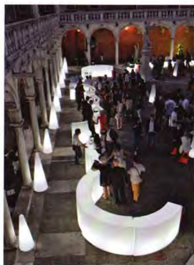
Vista by night del chiostro della Santissima Trinità.

stro della Santissima Trinità, si sviluppa in un percorso che va dai merletti di Karim Rashid alle policromie di Alessandro Mendini , dallo spirito giocoso di Denis Santachiara alle sperimentazioni di Flavio Lucchini . E poi ci sono i lavori di Giuseppe Spagnulo , Bruto Pomodoro , Andy e del coreano Park Eun-Sun . L'idea dell'azienda Slide ( www.slideart.com ), madrina del progetto, è stata quella di sfidare gli autori a cimentarsi con resine e materiali plastici di ultimissima generazione. Ogni opera sarà poi realizzata in edizione limitata.