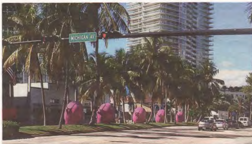
Le chiocciole del progetto «Re-generation» di Cracking Art esposte a Miami

Evento. Da domani negli spazi della 54ª edizione della kermesse di Venezia le opere e la creatività di artisti che vivono e lavorano all'ombra del Mucrone