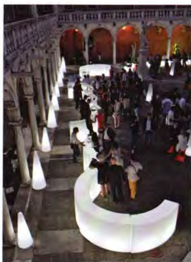
Vista by night del chiostro della Santissima Trinità.

stro della Santissima Trinità, si sviluppa in un percorso che va dai merletti di Karim Rashid alle policromie di Alessandro Mendini , dallo spirito giocoso di Denis Santachiara alle sperimentazioni di Flavio Lucchini . E poi ci sono i lavori di Giuseppe Spagnulo , Bruto Pomodoro , Andy e del coreano Park Eun-Sun . L'idea dell'azienda Slide ( www.slideart.com ), madrina del progetto, è stata quella di sfidare gli autori a cimentarsi con resine e materiali plastici di ultimissima generazione. Ogni opera sarà poi realizzata in edizione limitata.