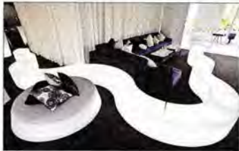
Il progetto Slide art-Sign Off Design, nelle foto in pagina alcuni pezzi, porta la firma dei grandi del design e dell'arte

Ottimi i risultati finanziari: l'azienda, che si era preffissata di raggiungere 15 milioni di fatturato entro il 2010 ha centrato l'obiettivo con una crescita annua del 15%. La sede operativa della società è a Buccinasco, alle porte di Milano ed è strutturata in modo da poter presentare due pro-