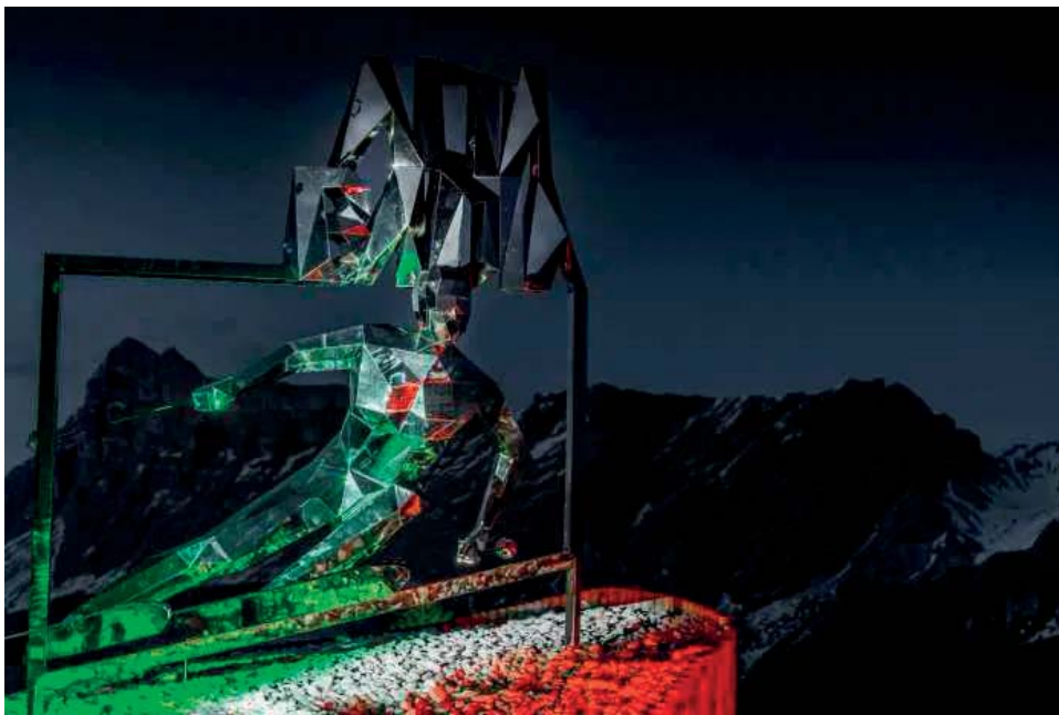
Il Gigant illuminato