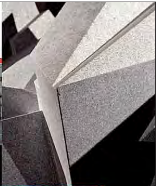
Geode “Universo Dentro”, in occasione di una esposizione, a Torino, in Piazza Vittorio. The Inner Universe geode exhibited in Piazza Vittorio, Turin.