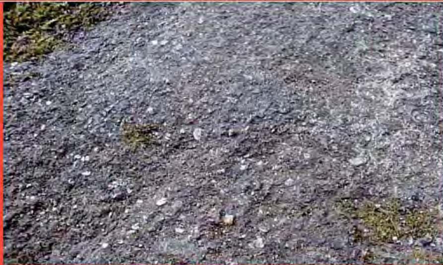
Mica muscovite nel filone Luz de Compostella™ / Muscovite mica in the Luz de Compostella™ seam.

La muscovite è un silicato appartenente al gruppo delle miche. Le lamine di questo materiale posseggono una lucentezza vitrea perlacea, interessante per la sfumatura talora argentata. Il termine "mica" si ritiene che derivi dal latino "micare" ossia "brillare". Il termine "muscovite" invece è da ricondurre alla città di Mosca, dove questo materiale veniva usato al posto del vetro in gran quantità: alcune abitazioni russe avevano finestre in muscovite. La mica muscovite si trova per lo più in rocce magmatiche intrusive in silice (graniti, sieniti, ecc.) e in rocce metamorfiche.